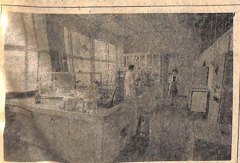
В химической лаборатории корпуса № 112.